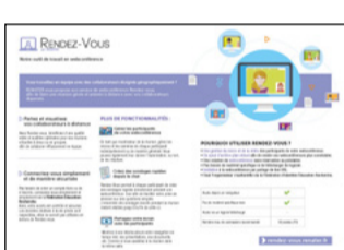
Fiches de présentation